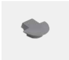
Endstück Kabelausgang grau (1x) PL1448