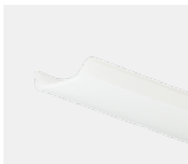
opal/ flach PL1547/1