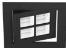
B schwarz RAL 9005