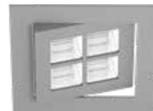
S silber RAL 9006