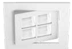
W weiß RAL 9016