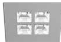
S silber RAL 9006