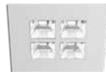
W weiß RAL 9016