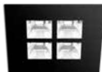
B schwarz RAL 9005